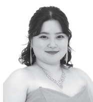
デスピーナ 赤壁 明里