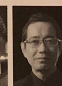
梅本 実 総合プロデュース ピアノ